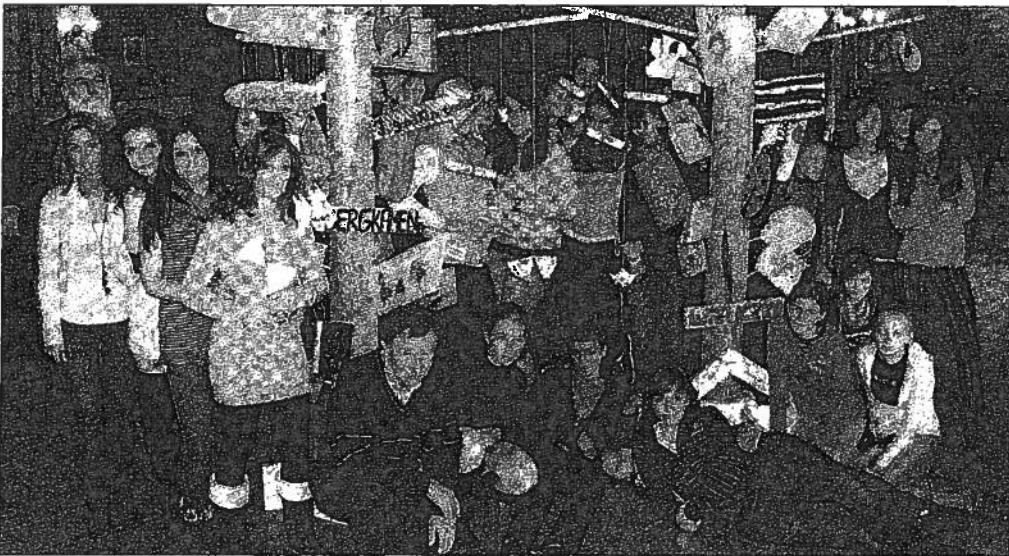
Während ihres Begegnungsprojekts arbeiteten die Schüler der Jugendkunstschule Bergkamen und die Jugendlichen aus Wieliczka an zwei Holzskulpturen.

Während ihrer Projektwoche besuchte die Gruppe zudem das Nationalmuseum in Krakau und die Kathedrale auf dem Wawel-Berg. Den Höhepunkt der Projektwoche bildete jedoch die Präsentation der beiden Partnerschaftsbäume, die zuvor gemeinsam von deutschen und polnischen Schülern montiert und fertiggestellt wurden. Das gemeinsame Abendessen rundete das Begegnungsprojekt ab. Die Jugendlichen der beiden Partnerstädte haben neue Freunde gefunden und wollen in Kontakt bleiben.